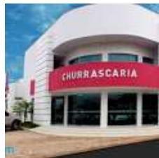
Gênova Palace H...