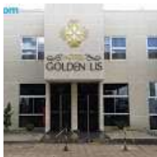
Hotel Lis Inn